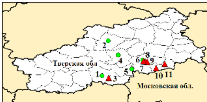
Рисунок. Карта распространения Agrilus planipennis в Тверской обл. Треугольники – пункты обнаружения. Круги – обследование дало отрицательный результат. В скобках – год обследования. 1 – Ржев (2013), 2 – Вышний Волочек (2013), 3 – Зубцов (2013), 4 – Торжок (2013), 5 – Нелидово (2013), 6 – Тверь, Центральный р-н (2013), 7 – Тверь, Московский р-н (2016), 8 – Тверь, пос. Химинститут (2015), 9 – Эммаус (2013), 10 – Новозавидовский (2013), 11 – Конаково (2013) (по: Straw et al., 2013; Орлова-Беньковская, 2013; Волкович, Мозолевская, 2014; собственные наблюдения).