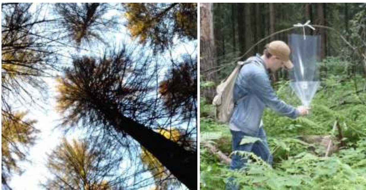
Рисунки 1 и 2. Состояние крон ели на пробной площади. Учет жуков короеда-типографа в феромонной ловушке

Учеты типографа в феромонных ловушках проводили в Московском регионе на двух участках: ПУ-1 в 2016-2019 гг. (3 ловушки) и ПУ-2 в 2018-2019 гг. (5 ловушек). ПУ-1 расположен вблизи СНТ Плесково, Михайлово-Ярцевского поселения в лесопарковом 80–100-летнем смешанном насаждении с преобладанием ели естественного происхождения [4]. ПУ-2 находится в Пироговском участковом лесничестве в существенно отличающемся по таксационной характеристике насаждении (чистые еловые культуры, 70-летнего возраста, неравномерной полноты, с «окнами» - поврежденными корневой губкой участками и действующими микроочагами короеда-типографа (рисунок 1). Проверка ловушек осуществлялась не реже, чем раз в 7 дней (рисунок 2).