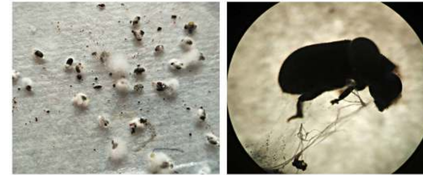
Рис. 3 – Ре-изоляция исходного штамма из погибших насекомых

Методы: Биотестирование быстрорастущих культур B. bassiana проводили на имаго P. proximus . Инфицирование контактным способом в течение 15 с. Температурный режим 16, 20 и 24±1 °С; фотопериод 12С:12Т, влажности воздуха 95%. Вирулентность оценивали по показателям смертности (%) и срока гибели (сут.). Погибших насекомых поверхностно стерилизовали и использовали для повторной изоляции гриба (рис. 3).