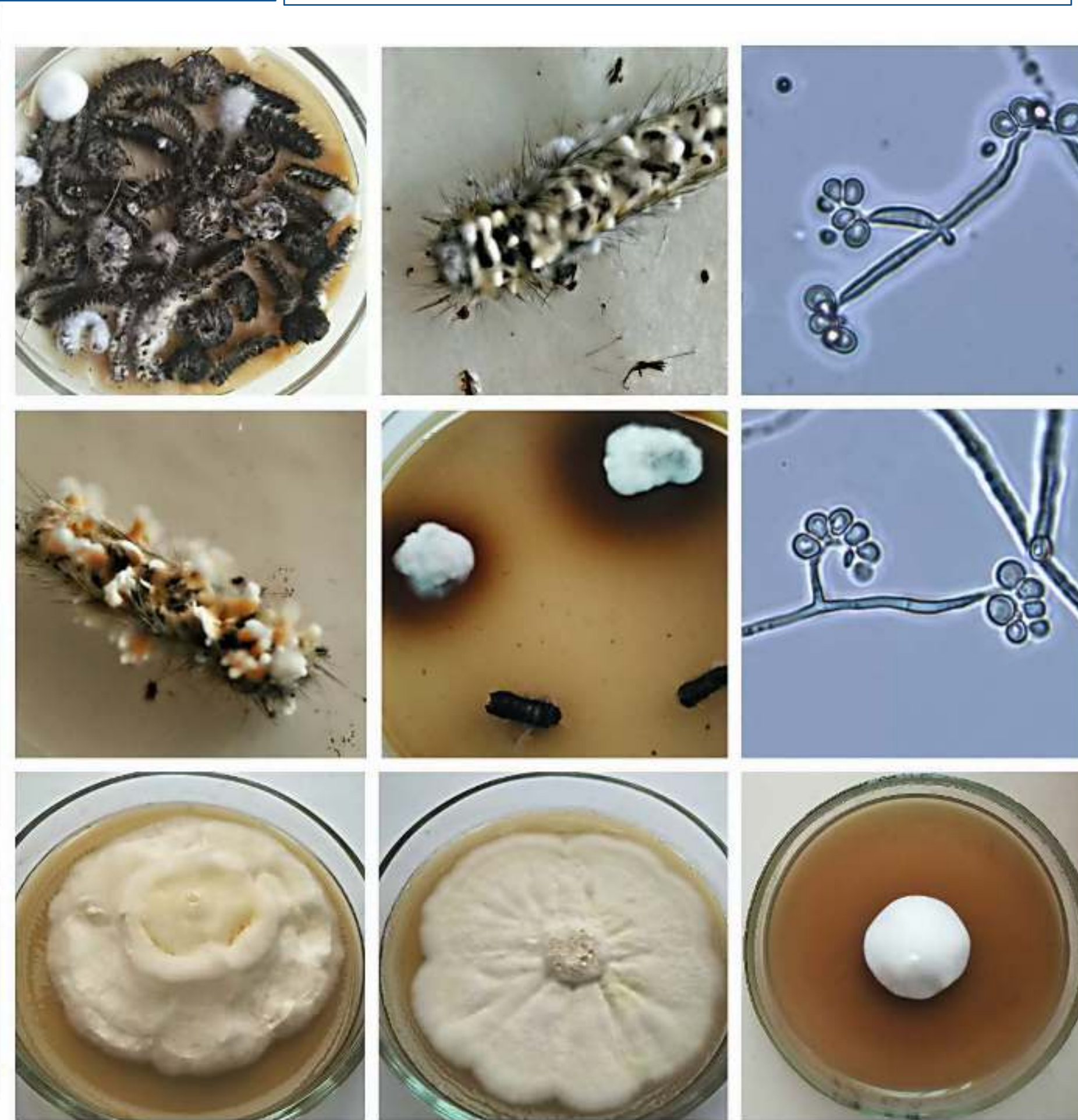
Рис. 2 – Изолирование в чистую культуру Beauveria bassiana