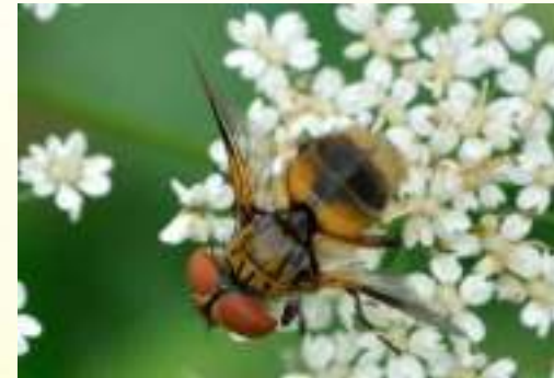
Семейство Ежемухи – Tachinidae