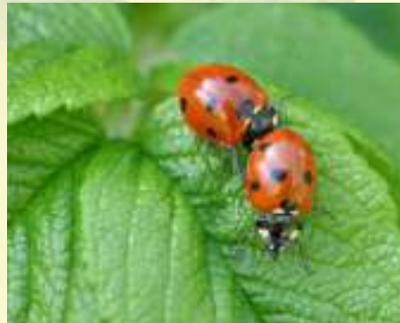
Божья коровка семиточечная – Coccinella septempunctata