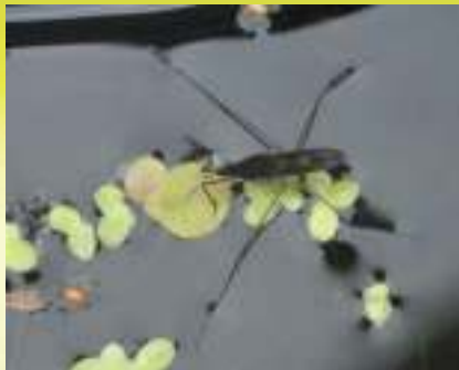
Семейство Водомерки - Gerridae