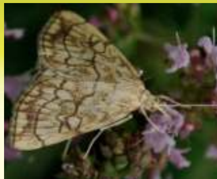
Мотылёк крестоцветный бледноватый – Evergestis pallidata