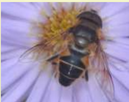
Пчеловидка – Eristalis sp.