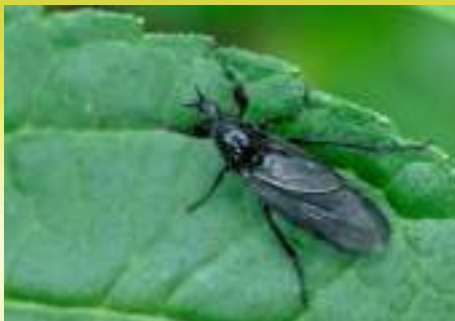
Семейство Толстоножки – Bibionidae