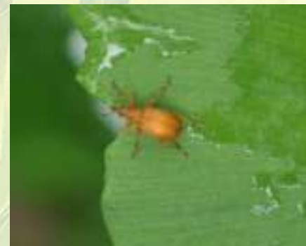
Семеед - Apion sp.