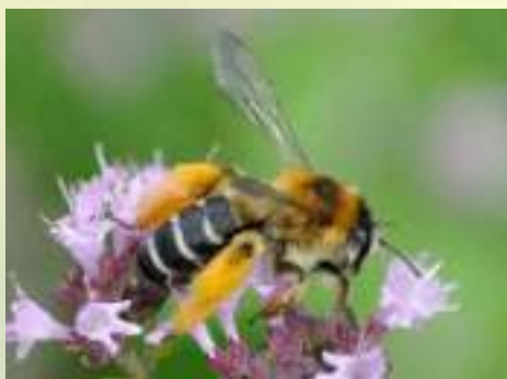
Пчела мохноногая - Dasipoda sp.