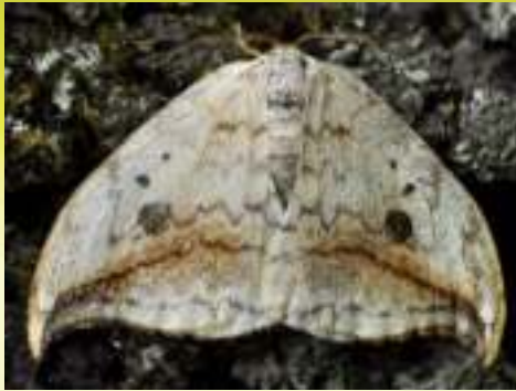
Серпокрылка березовая – Drepana falcataria