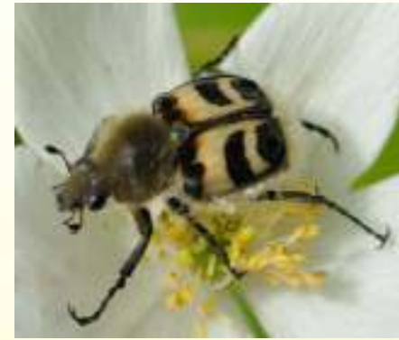
Восковник перевязанный – Trichius fasciatus