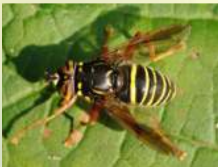
Журчалка глазастая – Spilomyia diophthalma