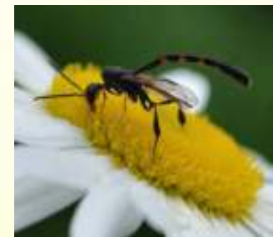
Семейство Ихневмониды – Ichneumonidae