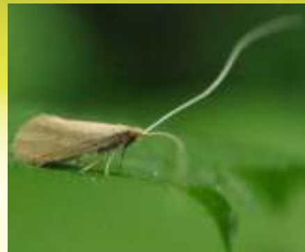
Семейство Длинноусые моли - Adelidae