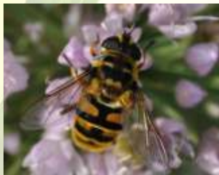
Журчалка цветочная – Myathropa florea