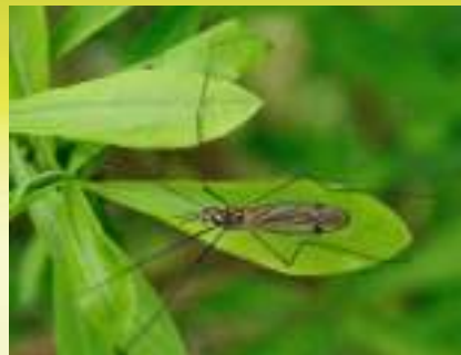
Комар-долгоножка – Nephrotoma rossica