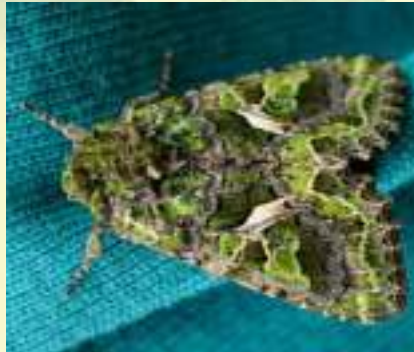
Совка лебедовая – Trachea atriplicis