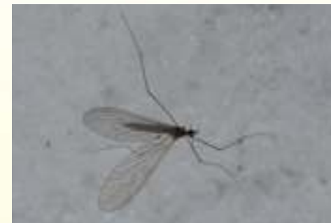
Семейство Зимние комары – Trichoceridae