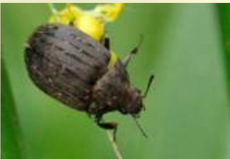
Пилюльщик обыкновенный – Byrrhus pilula