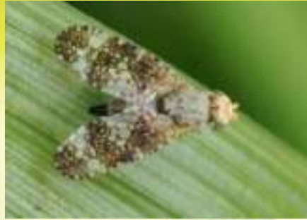
Оксина постенная – Oxyna parietina