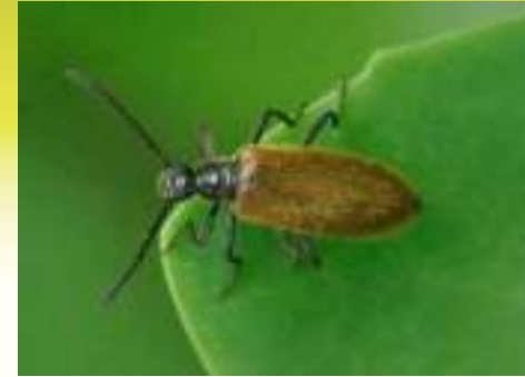
Мохнатка обыкновенная – Lagria hirta