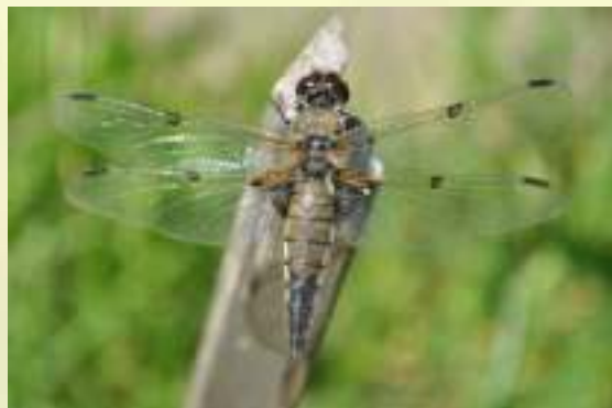
Стрекоза четырехпятнистая – Libellula quadrimaculata