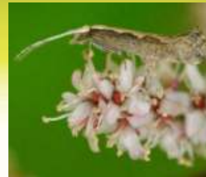
Моль капустная – Plutella xylostella