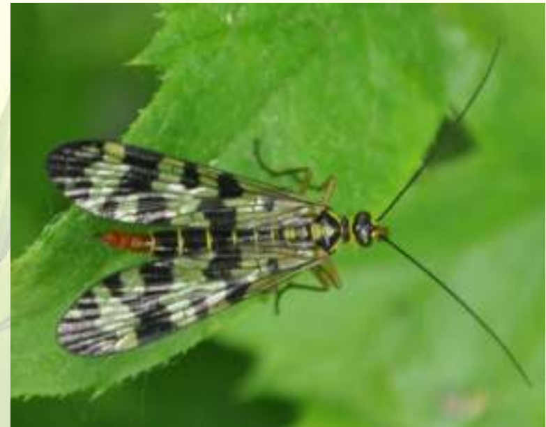
Скорпионница обыкновенная – Panorpa communis