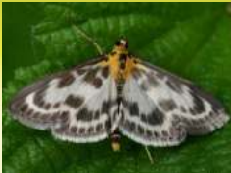
Огнёвка крапивная пёстрая – Anania hortulata