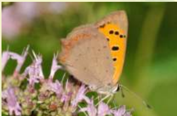
Червонец пламенный - Lycaena phlaeas