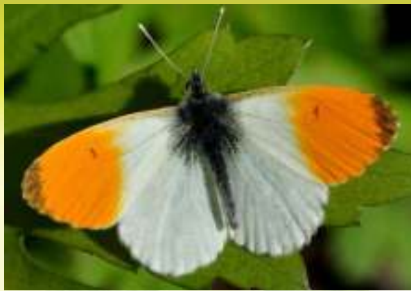
Зорька обыкновенная - Anthocharis cardamines