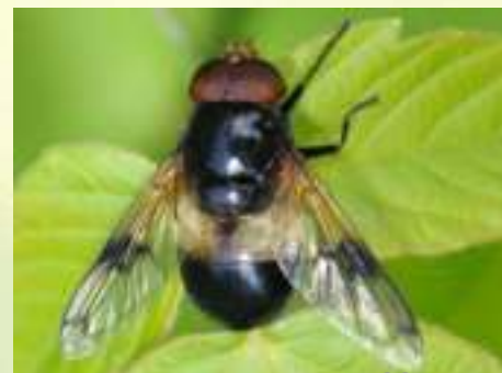
Журчалка прозрачная – Volucella pellucens