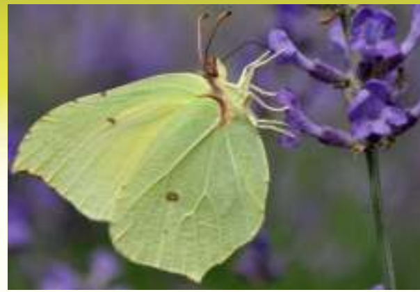
Крушинница - Gonepteryx rhamni