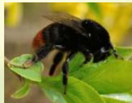
Шмель - Bombus sp.