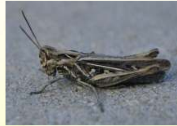
Конёк - Chorthippus sp.