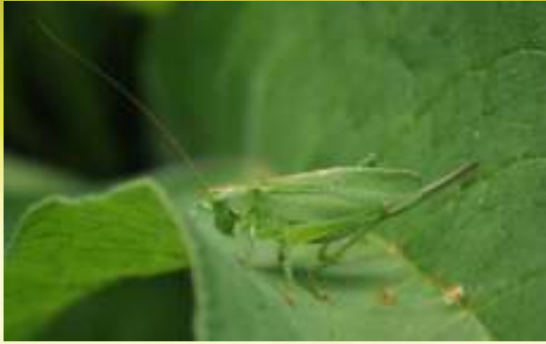
Кузнечик певчий - Tettigonia cantans