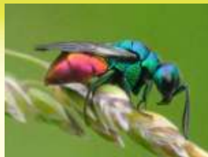
Семейство Осы-блестянки – Chrysididae