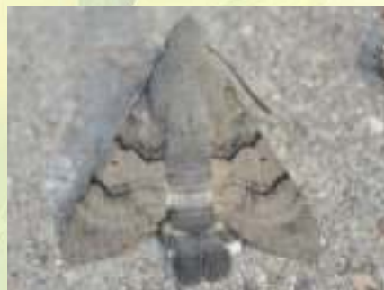
Языкан обыкновенный – Macroglossum stellatarum