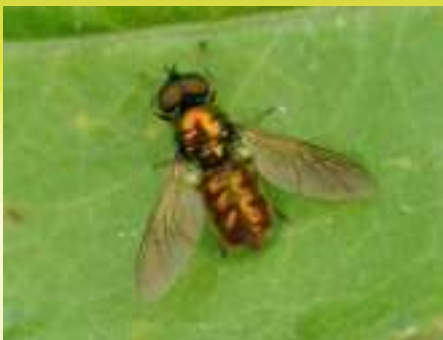
Семейство Львинки – Stratiomyidae