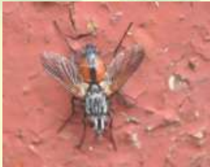
Семейство Ежемухи – Tachinidae