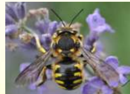
Шерстобит флорентийский – Anthidium florentinum