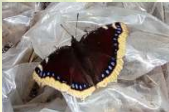
Траурница - Nymphalis antiopa