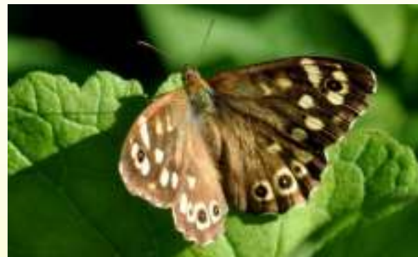
Краеглазка Эгерия - Pararge aegeria