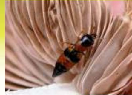
Стафилин рыжий – Oxyporus rufus