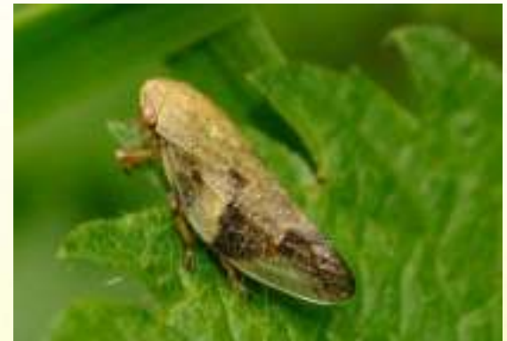
Пенница ольховая - Aphrophora alni