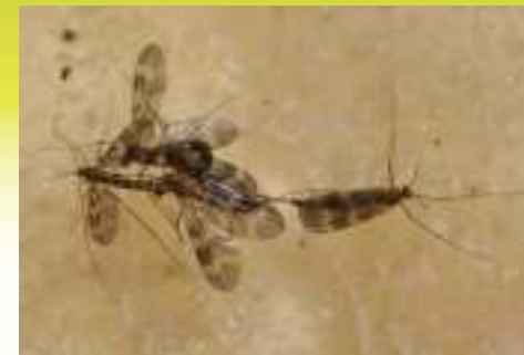
Гриболоб обыкновенный – Mycetophila fungorum