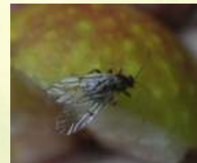
Дубовая орехотворка – Cynips quercusfolii