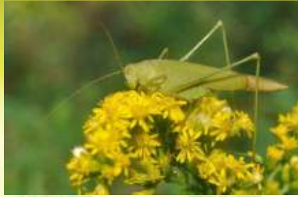
Пластинокрыл обыкновенный - Phaneroptera falcata