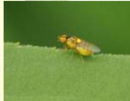
Семейство Зеленоглазки – Chloropidae