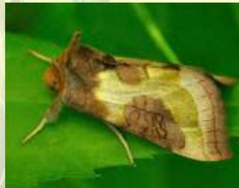
Металловидка золотая – Diachrysis chrysitis