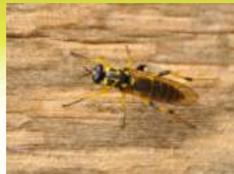
Семейство Осовидки – Xylomyidae