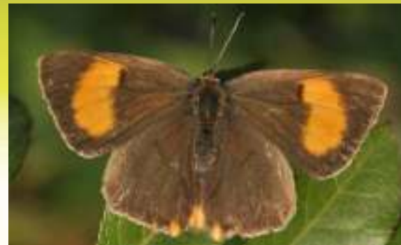
Зефир берёзовый - Thecla betulae