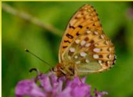
Перламутровка Аглая - Argynnis (= Mesoacidalia ) aglaja