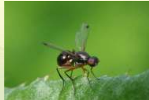
Семейство Муравьевидки – Sepsidae