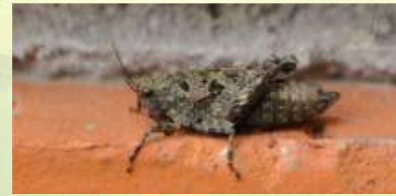
Прыгунчик – Tetrix sp.