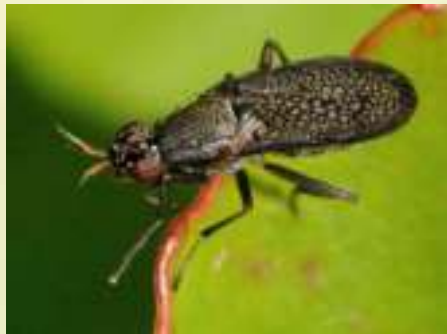
Тенница окаймлённая – Coremacera marginata