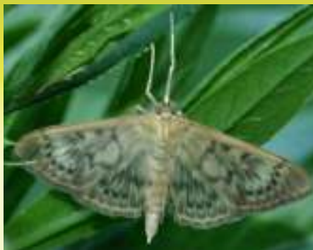
Огневка крапивная большая – Pleuroptya ruralis