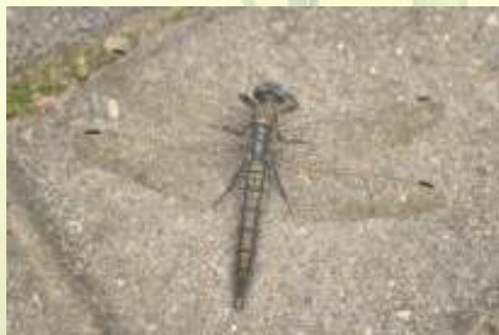
Стрекоза решетчатая - Orthetrum cancellatum