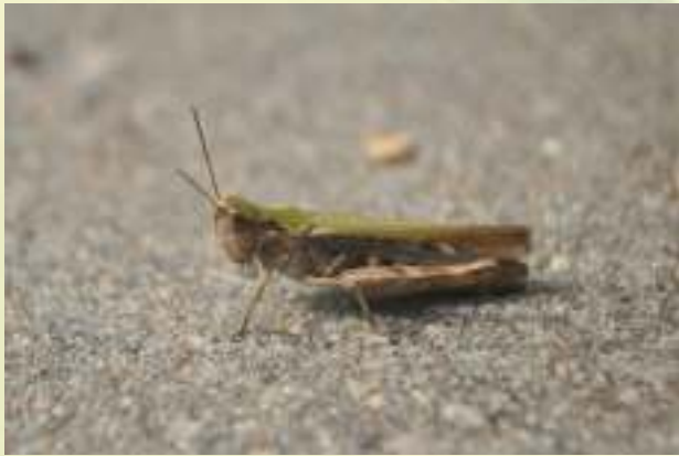
Конёк - Chorthippus sp.