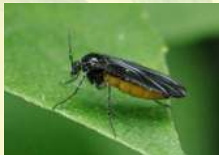
Семейство Комары-темнокрылы – Sciaridae