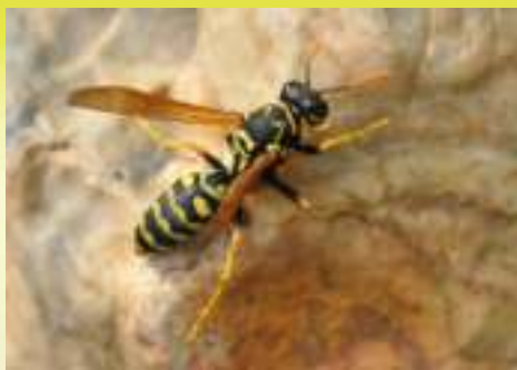
Осы- полисты - Polistes sp.