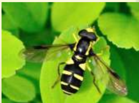
Ксантограмма – Xanthogramma pedissequum