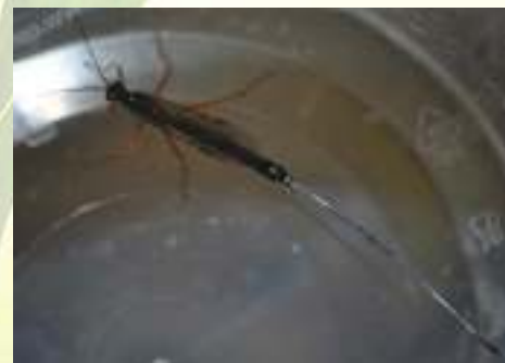
Семейство Ихневмониды – Ichneumonidae