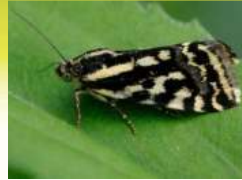
Совка вьюнковая – Emmelia trabealis