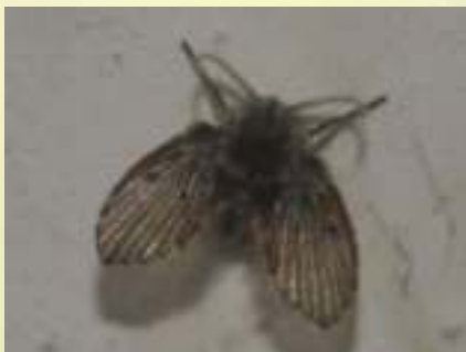
Семейство Бабочницы – Psychodidae