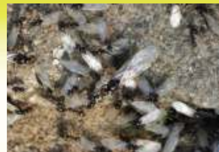
Чёрный садовый муравей - Lasius niger