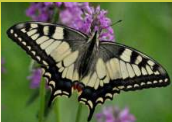
Махаон - Papilio machaon