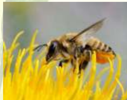
Мегахила – Megachile sp.