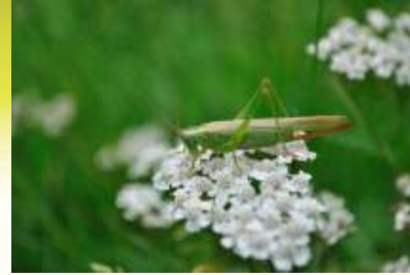
Мечник обыкновенный - Conocephalus discolor