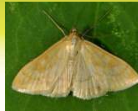
Огнёвка луговая – Sitochroa verticalis