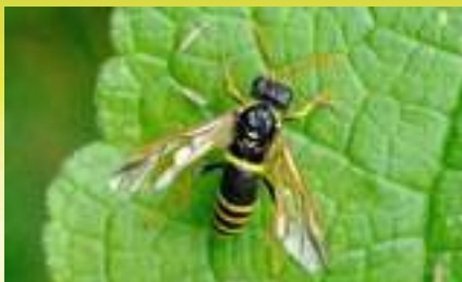
Пильщик норичниковый – Tenthredo scrophulariae