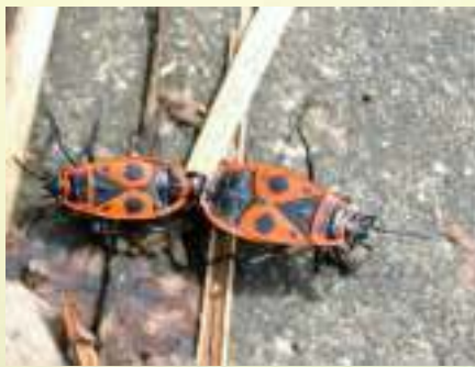
Клоп-солдатик – Pyrrhocoris apterus