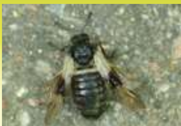
Семейство Булавоусые пильщики - Cimbicidae