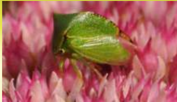
Бодушка бизонья - Stictocephala bisonia