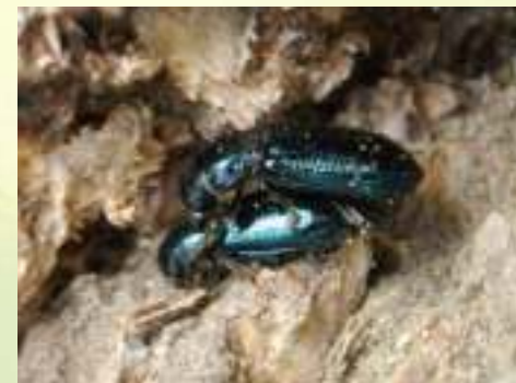
Заболонник берёзовый – Scolytus ratzeburgi