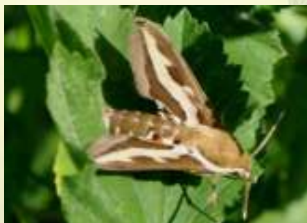
Бражник подмаренниковый – Hyles gallii