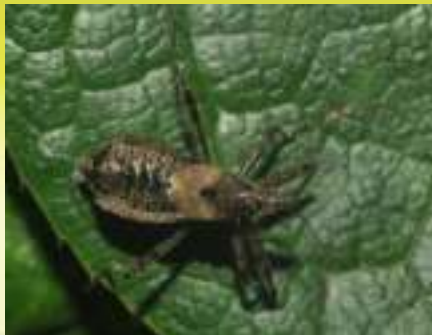
Клоп-охотник – Himacerus sp.