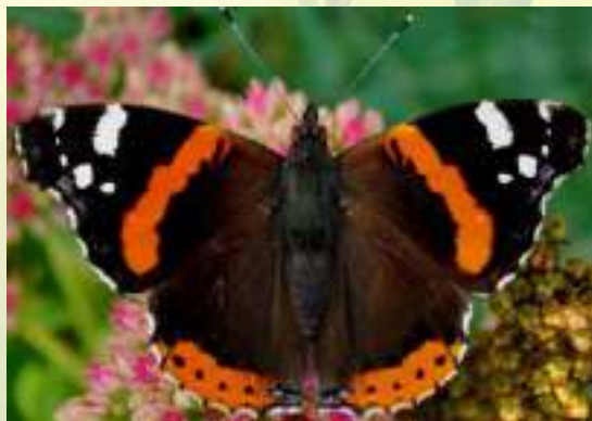
Адмирал - Vanessa atalanta