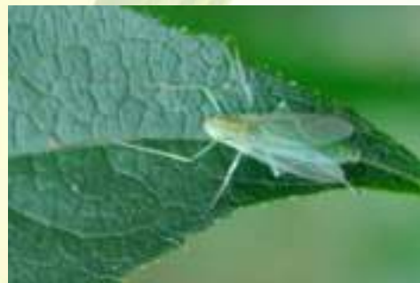
Семейство Комары-звонцы – Chironomidae