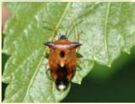
Эласмуха ржавая – Elasmucha ferrugata