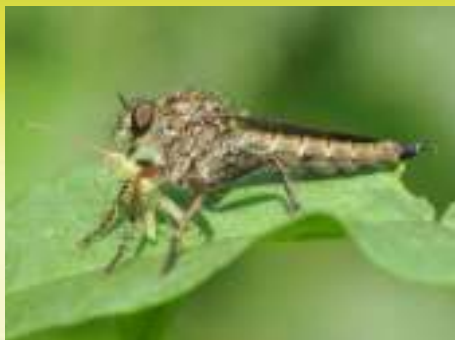
Семейство Ктыри – Asilidae