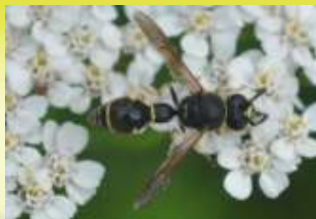
Пилюльная оса – Eumenes sp.