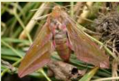
Бражник винный средний – Deilephila elpenor