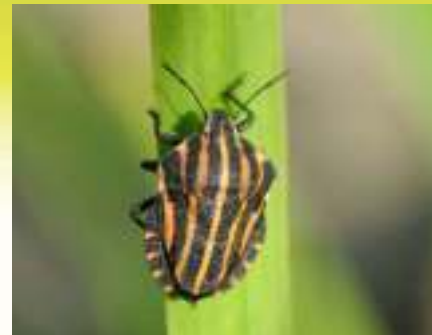
Щитник линейчатый – Graphosoma lineatum