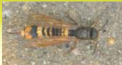
Берёзовый рогахвост – Tremex fuscicornis