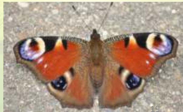
Павлиний глаз – Inachis io