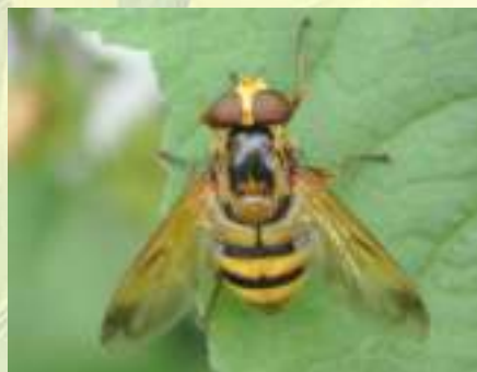
Шмелевидка воздушная – Volucella inanis