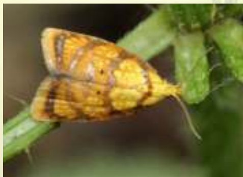
Листовёртка плоская розанная – Acleris bergmanniana