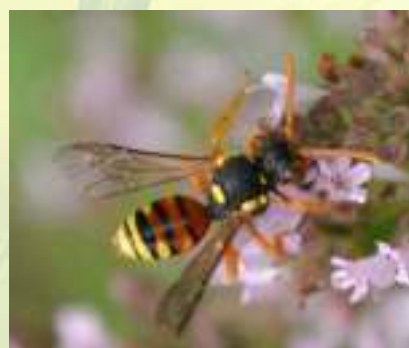
Пчела-бродяжка – Nomada sp.