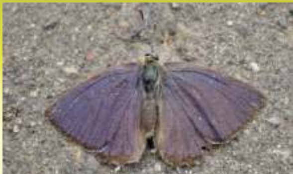
Зефир дубовый - Neozephyrus quercus