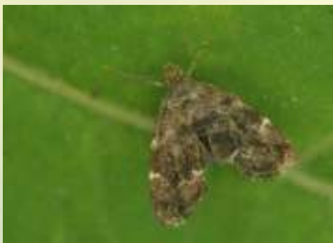
Моле-листовёртка крапивная – Anthophila fabriciana