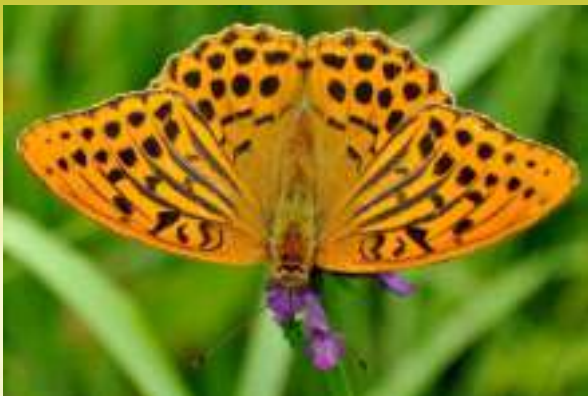
Перламутровка Пафия - Argynnis raphia