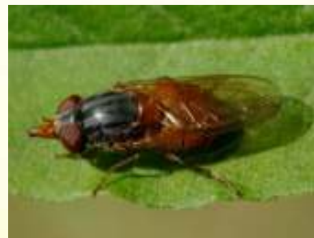
Журчалка носатая – Rhingia rostrate