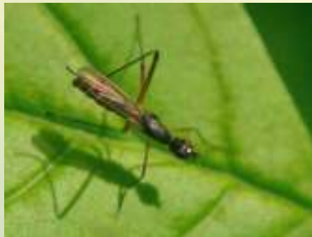
Семейство Микропезиды – Micropezidae