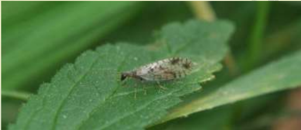
Семейство Гемеробы - Hemerobiidae