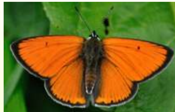
Червонец непарный - Lycaena (=Thersamolycaena) dispar