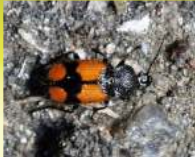
Шееголов – Panagaeus sp.