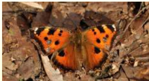
Нимфалида чёрно-жёлтая – Nymphalis xanthomelas