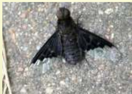
Темнокрылка чёрная – Hemipenthes maurus