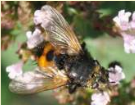
Семейство Ежемухи – Tachinidae