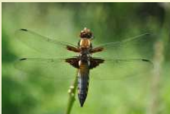
Стрекоза плоская – Libellula depressa