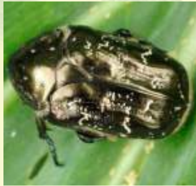
Бронзовка мраморная – Protaetia marmorata