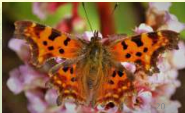
Углокрыльница с-белое - Polygonia c-album