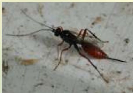
Семейство Ихневмониды – Ichneumonidae