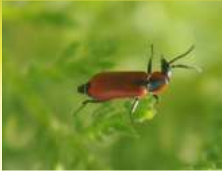
Малашка - Anthocomus sp.