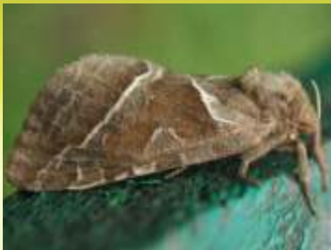
Тонкопяд лесной – Triodia silvina