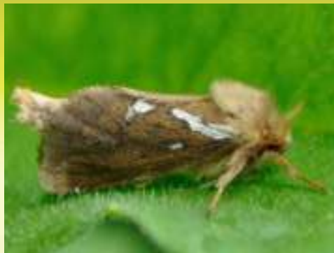
Тонкопяд волчий – Korscheltellus lupulina