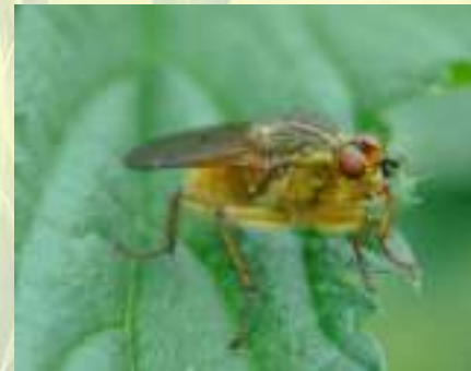
Семейство Скатофагиды – Scathophagidae