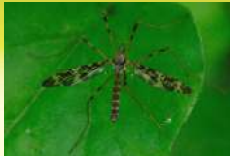
Болотница глазчатая – Eiphragma ocellare