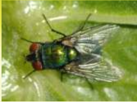
Семейство Падальницы – Calliphoridae