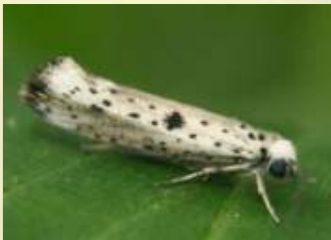
Семейство Горностаевые моли - Yponomeutidae