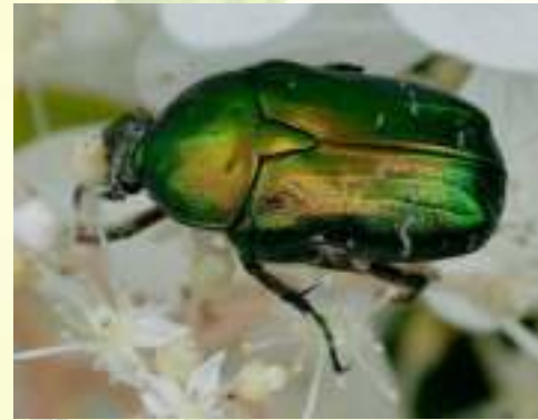
Бронзовка золотистая – Cetonia aurata