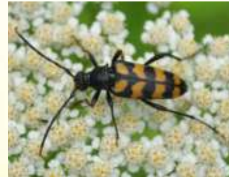
Лептура четырёхполосая – Leptura quadrfasciata