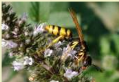
Пчелиный волк – Philanthus triangulum