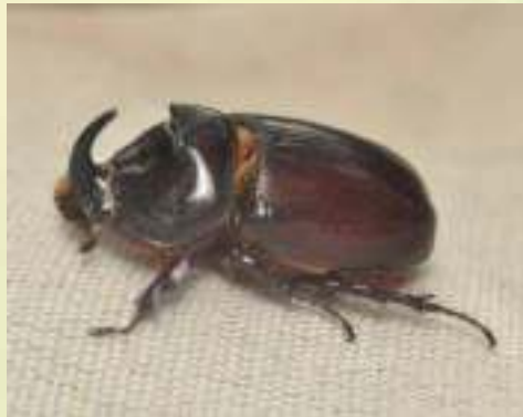
Жук-носорог – Oryctes nasicornis