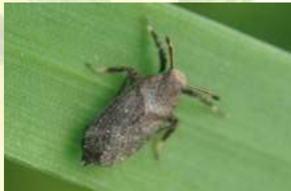
Свинушка - Asiraca sp.