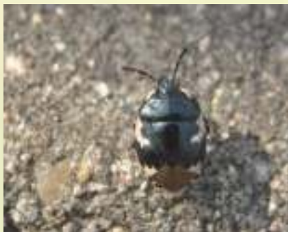
Земляной щитник двуцветный – Tritomegas bicolor