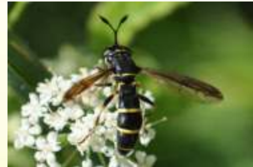
Семейство Большеголовки – Conopidae