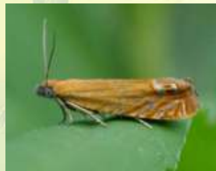
Листовёртка глазковая зверобойная – Lathronympha strigana