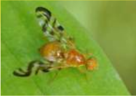
Ацидия родственная – Acidia cognate