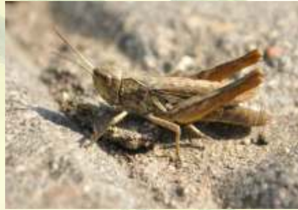
Конёк - Chorthippus sp.