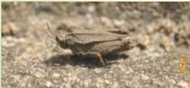
Прыгунчик – Tetrix sp.