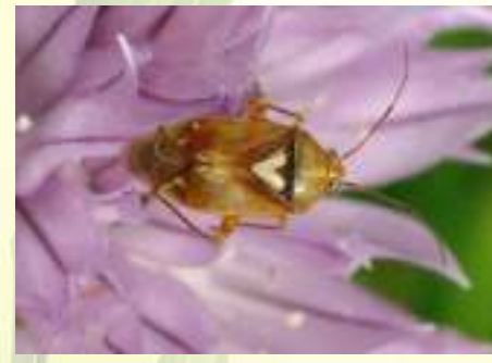
Слепняк луговой – Lygus pratensis