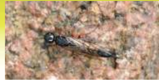
Мечехвост удлинённый – Xyphidria prolongata