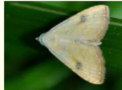
Совка малорослая – Rivula sericealis