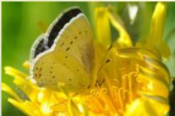
Голубянка Аргиад - Cupido argiades