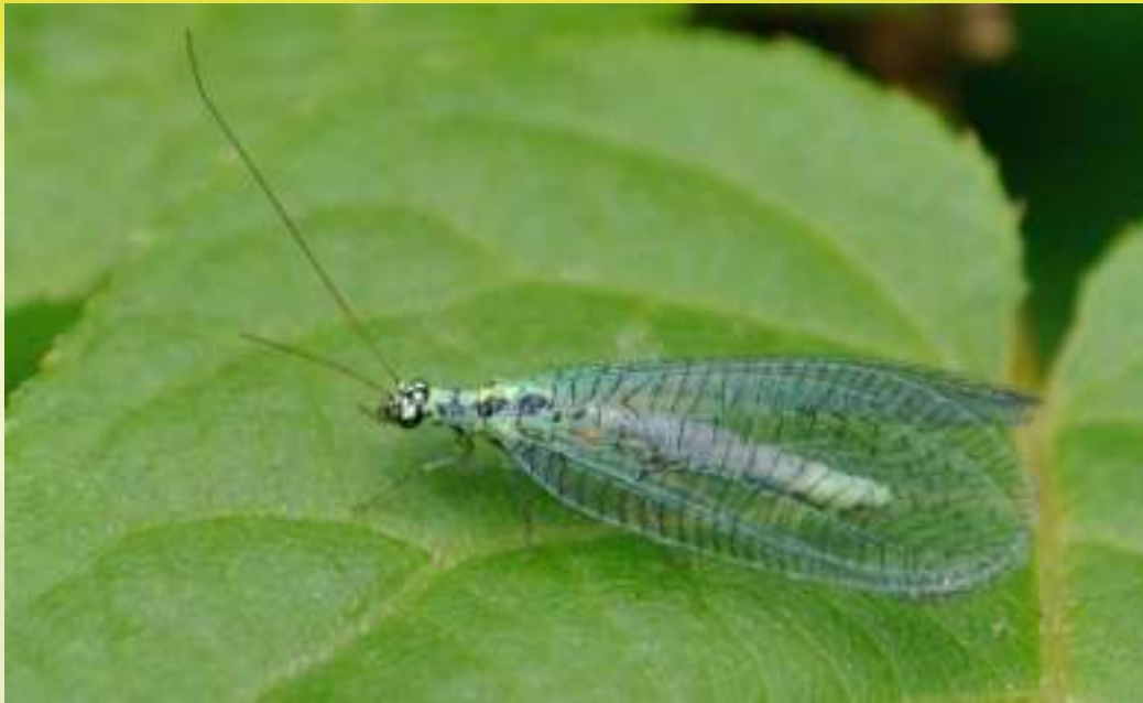
Златоглазка радостная - Chrysopa perla