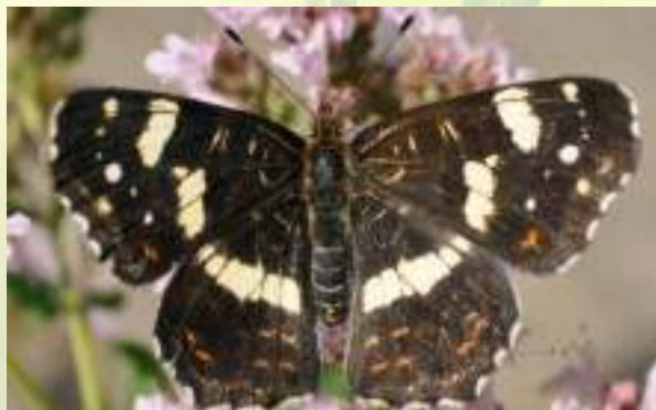
Пестрокрыльница изменчивая – Araschnia levana