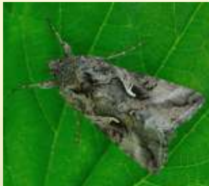
Металловидка гамма – Autographa gamma