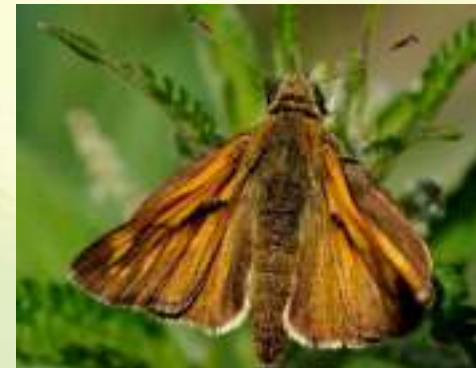
Семейство Толстоголовки – Hesperiidae