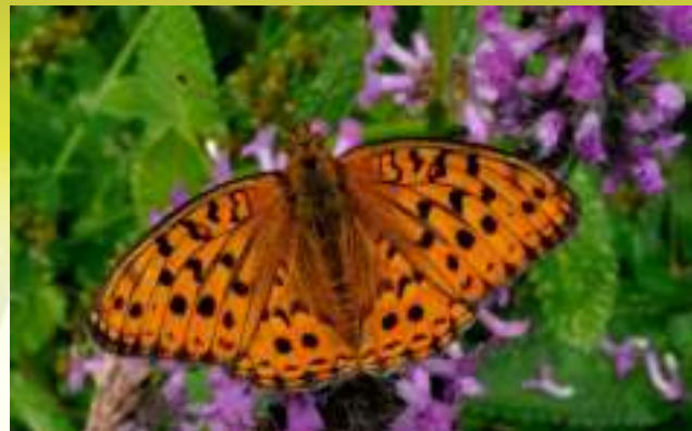
Перламутровка Адиппа - Argynnis (= Fabriciana ) adippe