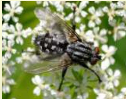
Семейство Саркофарида – Sarcophagidae