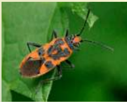
Булавник беленовый – Corizus hyoscyami