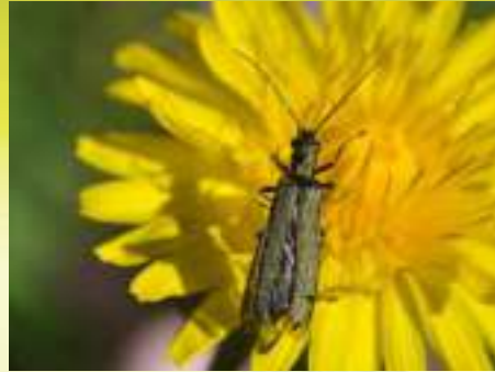
Узконадкрылка - Oedemera sp.