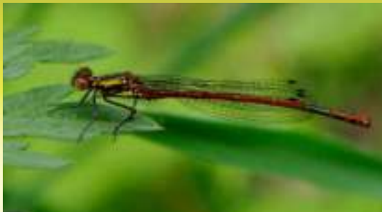
Красотелка - Pyrrhosoma nymphula