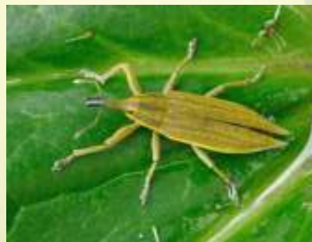
Фрачник обыкновенный – Lixus iridis