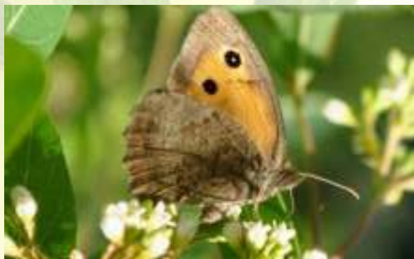
Бархатница Ликаон - Nymphophele lycan