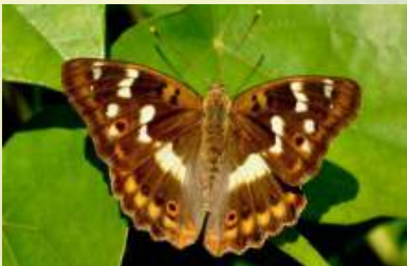
Переливница Илия - Aratura ilia