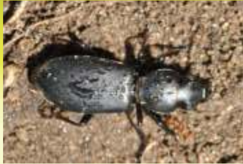
Жужелица головастая – Brosicus cephalotes