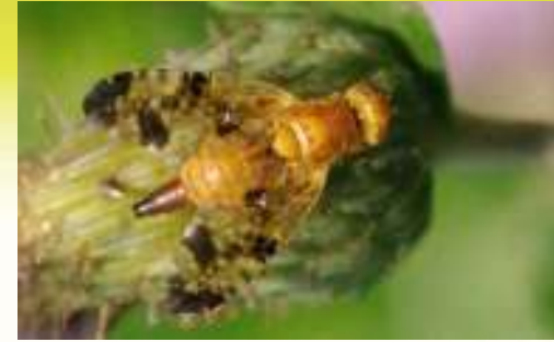
Пестрокрылка просяная – Xyphosia miliaria