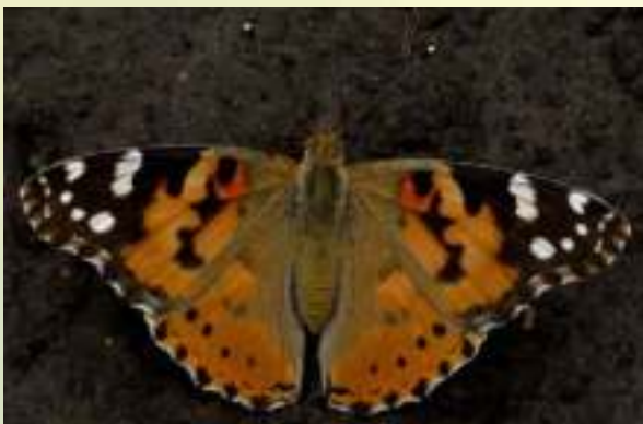
Репейница - Vanessa (= Cynthia ) cardui