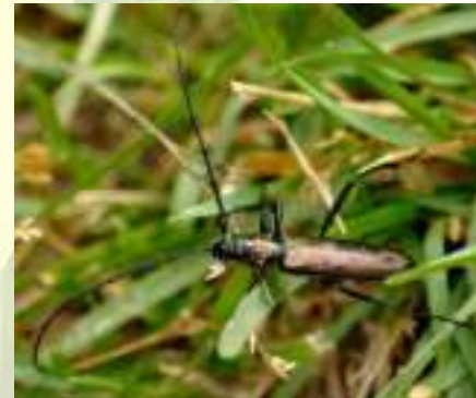
Усач мускусный – Aromia moschata