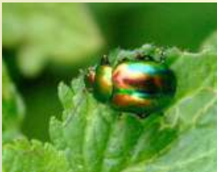
Листоед ясноточный – Chrysolina fastuosa