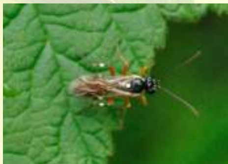
Семейство Ихневмониды – Ichneumonidae