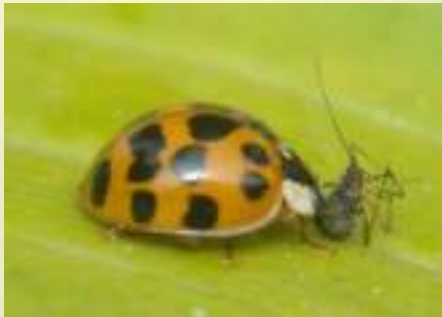
Хармония изменчивая, или Божья коровка-арлекин - Harmonia axyridis