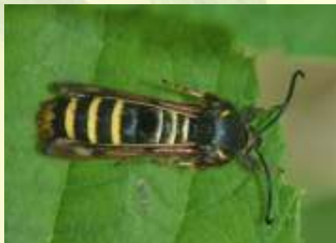
Стекланница малинная – Pennisetia hylaeiformis