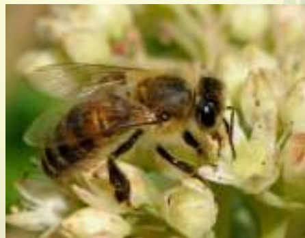
Пчела медоносная – Apis mellifera