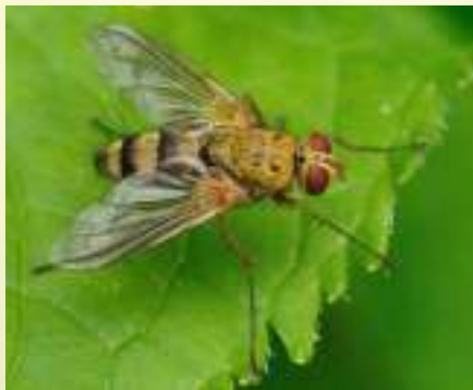
Дексиосома собачья – Dexiosoma caninum