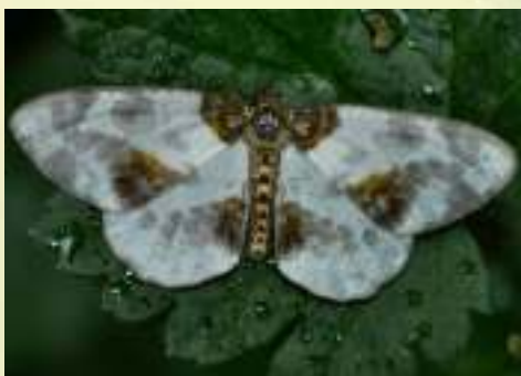
Пяденица пёстрая вязовая – Abraxas sylvata