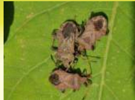
Краевик окаймлённый – Coreus marginatus