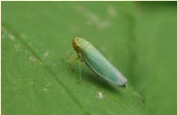
Цикадка зелёная - Cicadella viridis