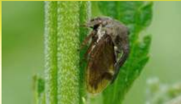
Горбатка обыкновенная - Centrotus cornutus