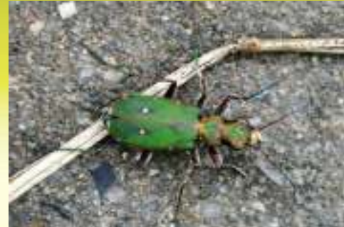
Скакун полевой – Cicindela campestris