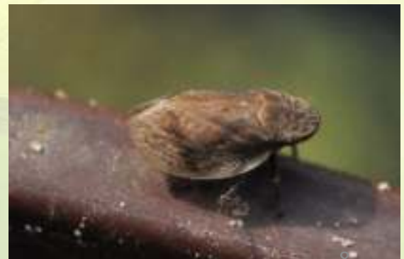
Пенница твердокрылая - Lepyronia coleoptrata