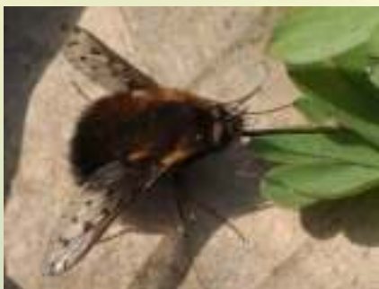
Жужжало разноцветное – Bomblylius discolor