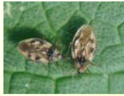
Диктила окопниковая – Dictyla humuli