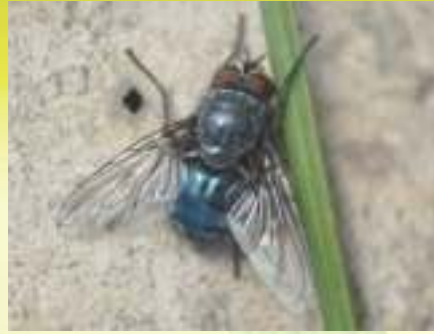
Семейство Падальницы – Calliphoridae