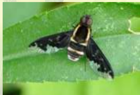
Печальница дымчатая – Hemipenthes morio