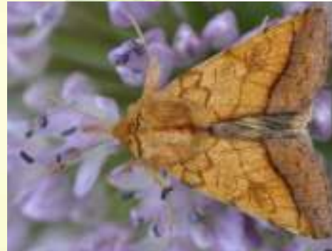
Совка стальниковая – Pyrrhia umbra