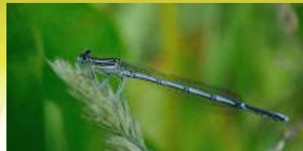
Плосконожка крылоногая - Platycnemis pennipes