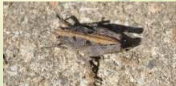
Прыгунчик – Tetrix sp.