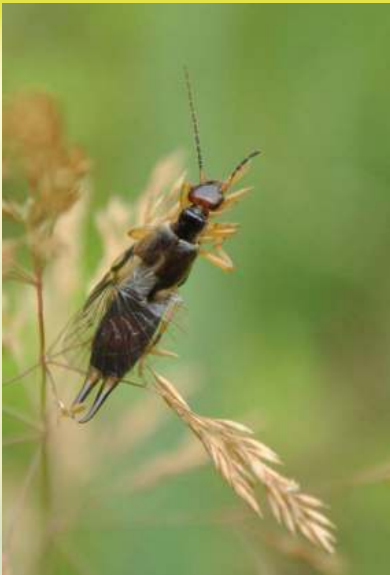
Уховёртка обыкновенная - Forficula auricularia