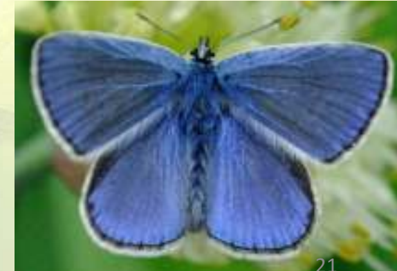
Голубянка Икар - Polyommatus icarus