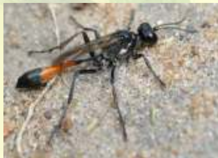
Аммофила – Ammophila sp.