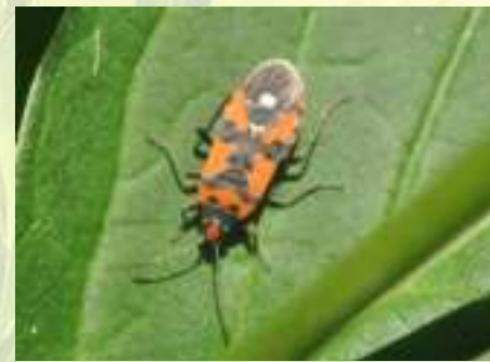
Наземник оседланный – Lygaeus equestris