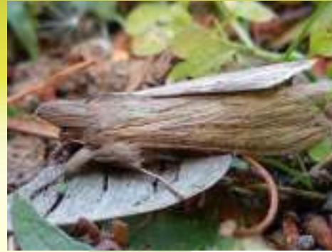
Капюшонница серая – Cucullia umbratica