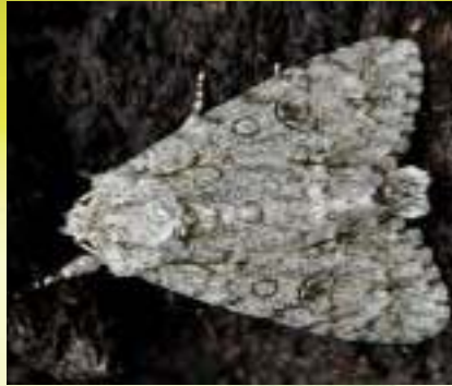
Стрельчатка кленовая – Acronicta aceris