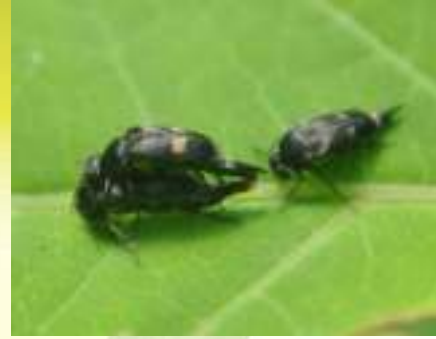
Шипоноска - Variimorda sp.