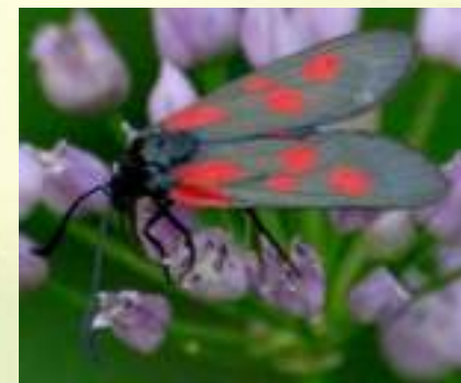
Семейство Пестрянки – Zygaenidae