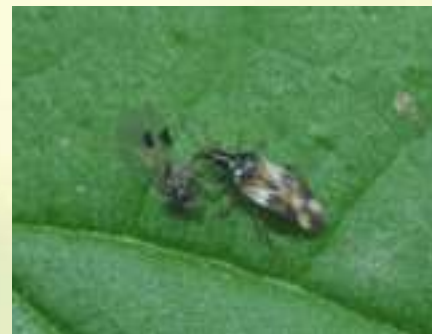
Антокорис дубравный – Anthocoris nemorum