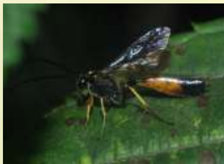
Семейство Ихневмониды – Ichneumonidae