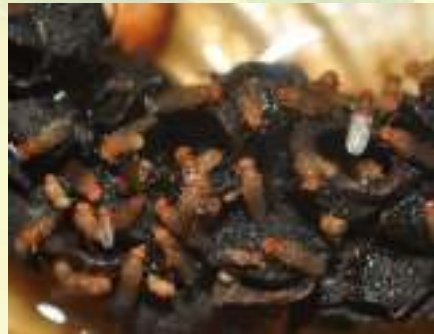
Семейство Дрозофилы – Drosophilidae