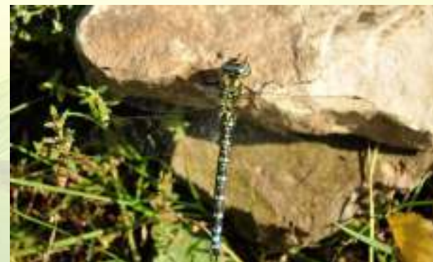
Коромысло синее - Aeshna cyanea