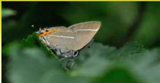
Хвостатка вязовая - Satyrion w-album