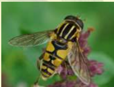
Ильница пижамная – Helophilus pendulus