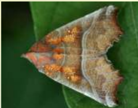
Совка зубчатокрылая – Scoliopteryx libatrix