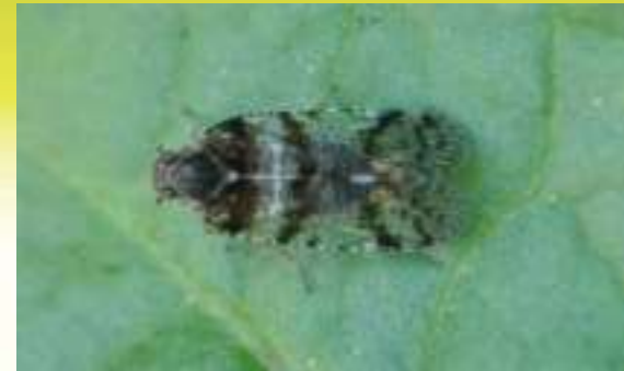
Носатка - Cixius sp.