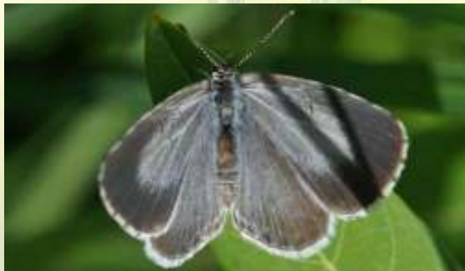
Голубянка крушинная - Celastrina argiolus