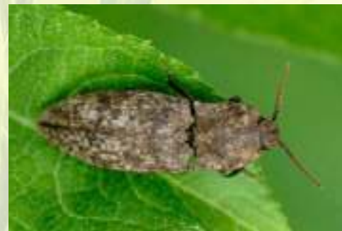
Щелкун мышино-серый – Agryphnus murinus