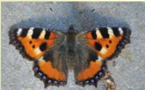
Крапивница - Aglais urticae