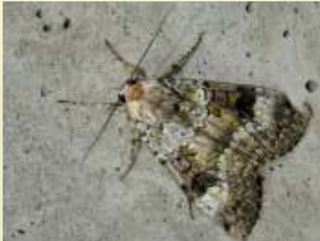
Совка большая зеленоватая – Anaplectoides prasina