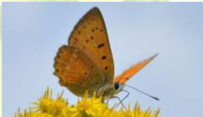
Червонец огненный - Lycaena virgaurea