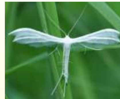
Пальцекрылка сливовая – Pterophorus pentadactylus