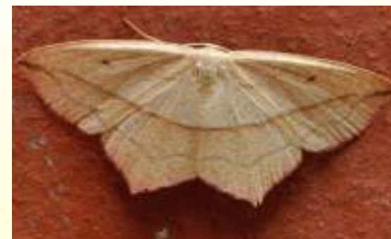
Пяденица щавелевая – Timandra comae