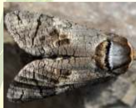
Древооточец пахучий – Cossus cossus