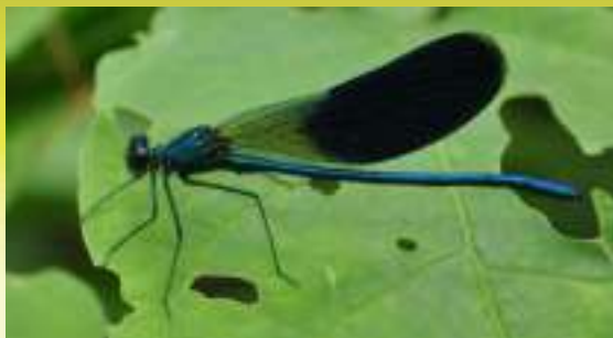
Красотка блестящая - Calopteryx splendens