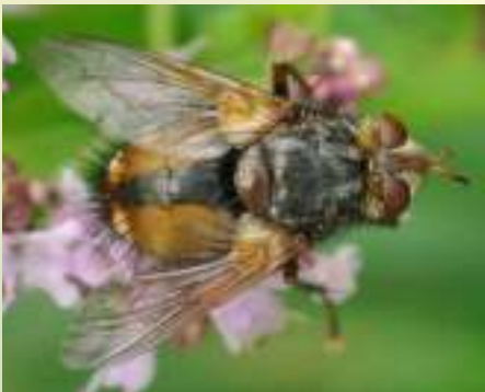
Ежемуха свирепая – Tachina fera