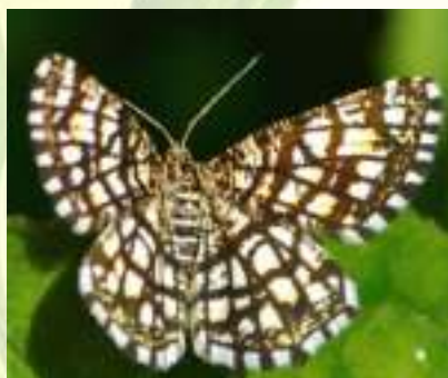
Пяденица клеверная – Chiasmia clathrate