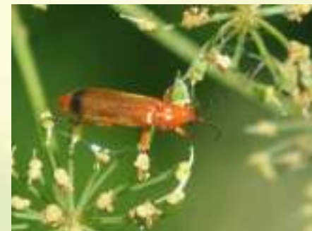
Мягкотелка зонтичная – Rhagonycha fulva