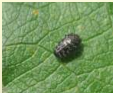
Златка минирующая ивовая – Trachys minuta