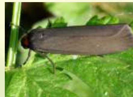
Лишайница тёмная – Atolmis rubricollis