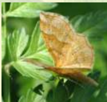
Пяденица каёмчатая черничная – Cepphis advenaria