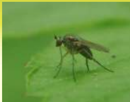
Семейство Зеленушки – Dolichopodidae