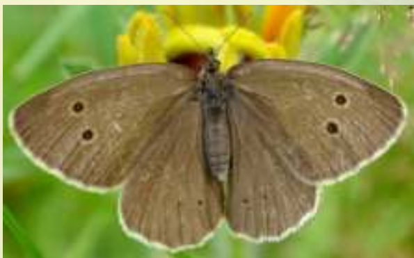
Бархатница Гиперант - Aphantopus hyperantus