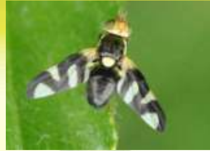
Пестрокрылка бодяковая – Urophora cardui