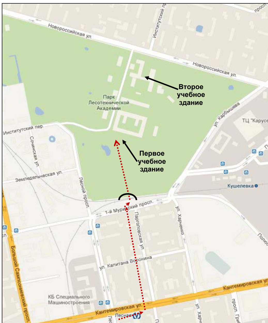
Расположение учебных зданий в Парке СПбГЛТУ

Далее по парку можно пройти до Второго учебного здания и далее к гостиницам «Мармара» и «Спутник». Пожалуйста, очень аккуратно переходите улицу в этом месте и только по пешеходным переходам со светофорам.